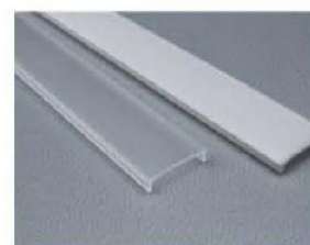
givrée ou opalin