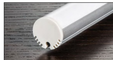
NTALB08 - OP