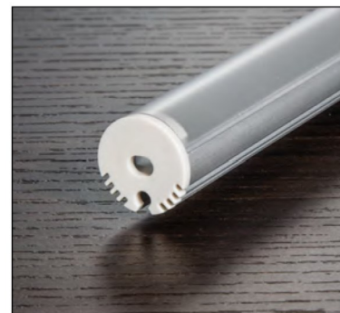
NTALB08 - FR

Conforme à la norme ANSI/UL UL-2108 Certifié à la norme CAN/CSA 22.2-9.0