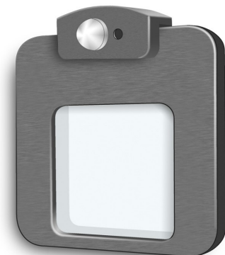
01- Détecteur de mouvement intégré