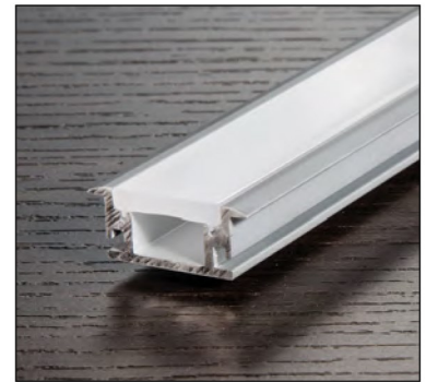
NTALB33 - FR